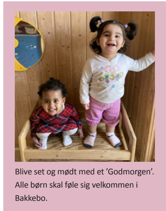
Blive set og mødt med et 'Godmorgen'. Alle børn skal føle sig velkommen i Bakkebo.

Social og kulturel dannelse handler om at lære respekt for sig selv, andre og sine omgivelser. I Børnehuset Bakkebo lægger vi vægt på den gensidige respekt og har positive forventninger til det enkelte menneske. Vi er nysgerrige og vil lære af hinanden, som noget af det grundlæggende for at kunne agere som individ i et demokratisk samfund.